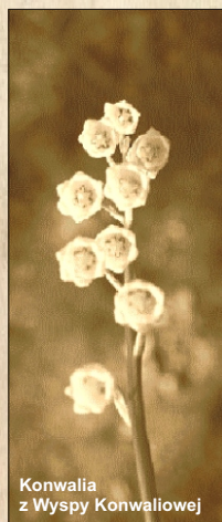
Konwalia z Wyspy Konwaliowej

Gmina Przemęt położona jest na Nizinie Wielkopolskiej. Stanowi jedną z trzech gmin tworzących powiat wolsztyński. Zajmuje obszar 22.531 ha, który zamieszkuje około 13.600 osób. Gminę tworzy 25 sołectw.